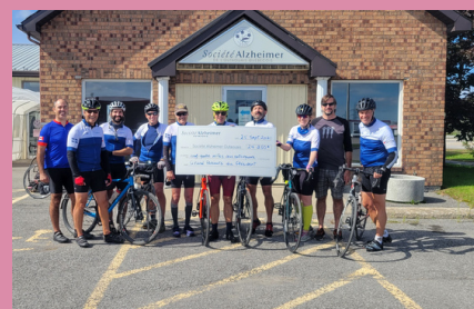
Grand parcours du président